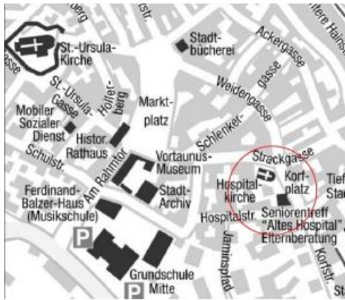
L'emplacement du mémorial.

L'association « Nie wieder 1933 » ( Plus jamais 1933 ), union d'organisations et de partis politiques d'Oberursel gagnés à cette cause et fondée en 1981 a pris l'initiative d'organiser un concours ouvert à tout public pour ériger un monument du souvenir et de l'exhortation. L'emplacement choisi est la place à côté de l'église Hospitalkirche dans la vieille ville.