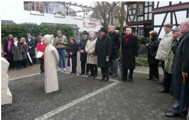
Pose de la deuxième figure, don du groupement Oberurseler Wohnungsbaugenossenschaft.