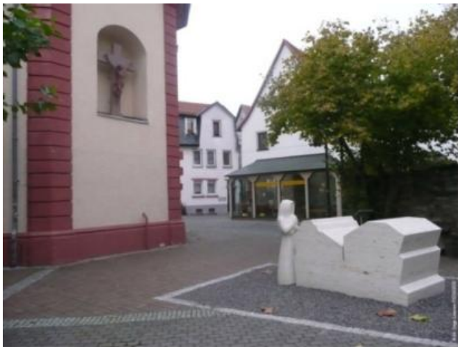
le bloc central et la première figure

En mars 2009, pose du 2ème personnage grâce à un don substantiel.